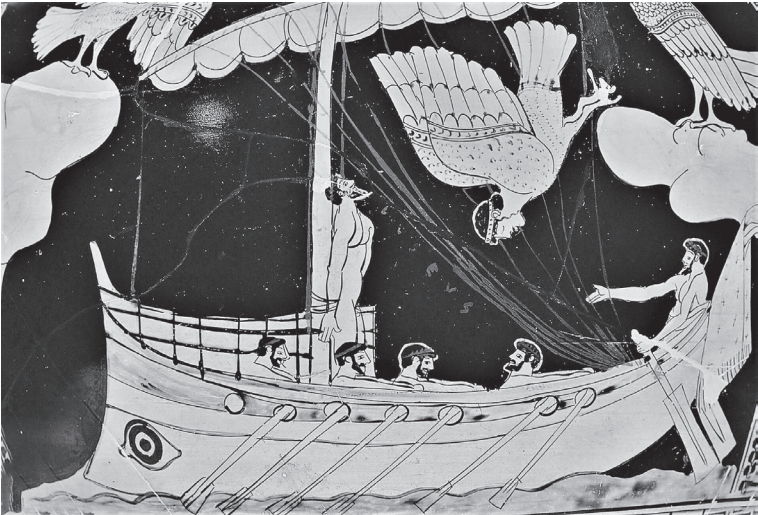
Odysseus und die Sirenen. Ausschnitt aus einem attischen rotfigurigen Stamnos, ca. 480–470 v. Von Vulci.